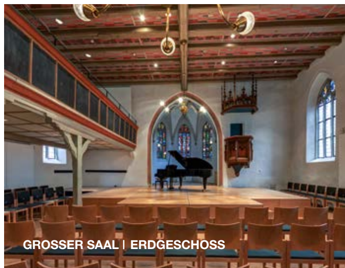
GROSSER SAAL | ERDGESCHOSS

MITTE 12. JH. WALLFAHRTSKAPELLE ZUM HEILIGEN KREUZ MITTE 15. JH. VERLEGUNG DES BEGRÄBNISPLATZES VOR DAS OBERE TOR ZUR KREUZKAPELLE 1455 NEUBAU DER JETZIGEN KIRCHE UM 1500 EINWÖLBUNG DES CHORES 1535 EINFÜHRUNG DER REFORMATION IN NÜRTINGEN 1570 NUTZUNG DES DACHRAUMES ALS KORNSCHÜTTE 1602 DACHREITER/TÜRMLEIN/ MIT GLOCKE ANFANG 19. JH. VERWENDUNG ALS MILITÄRMAGAZIN 1822 WIEDER FRIEDHOFSKIRCHE 1830 VERLEGUNG DES FRIEDHOFES 1842 WIEDERHERSTELLUNG DES AUSSEREN 1866 - 1928/29 GRÜNDLICHE INSTANDSETZUNGEN DER KIRCHE 1929 EXPRESSIONISTISCHE AUSMALUNG 1974 VERKAUF AN DIE STADT NÜRTINGEN 1975/76 RENOVIERUNG DES AUSSEREN 1985/86 UMBAU FÜR DIE KULTURARBEIT DER STADT